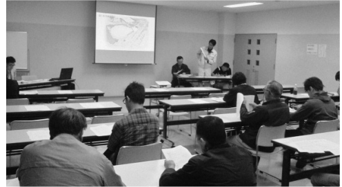
6月13日生産者協議会全体会議の様子