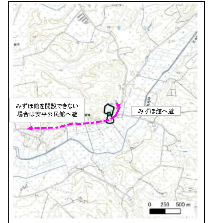
位置図 (図の上位が北を示す)