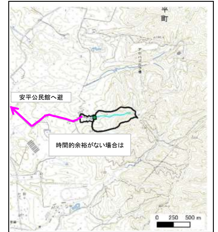
位置図 (図の上位が北を示す)