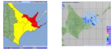
～雨の強さと災害の発生状況～