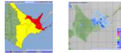
～雨の強さと災害の発生状況～