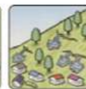
斜面から水がふき出す