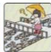
雨が降り続けているのに川の水位が下がる