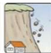
小石がバラバラ落ちてくる