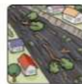
川の流れが濁り流木が混ざりはじめる