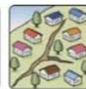
地面にひび割れができる